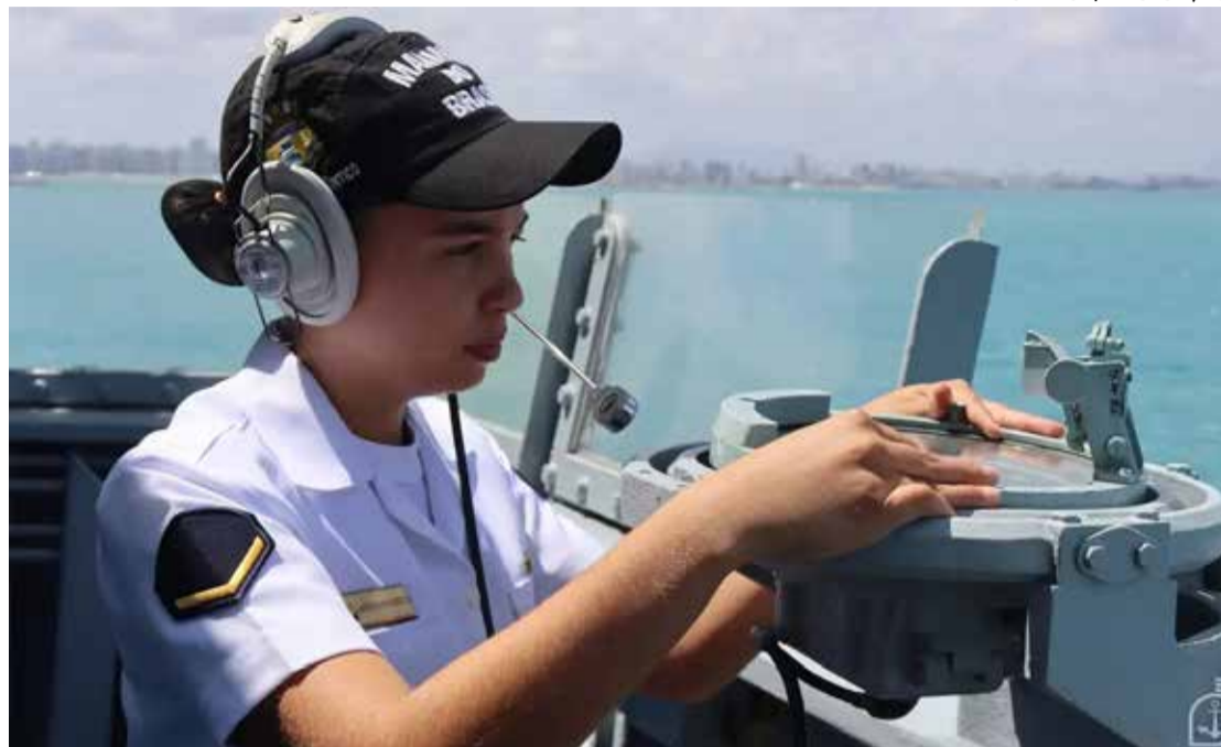
Segundo o Ministério da Defesa, ao longo de 2026, 1.467 mulheres deverão prestar o serviço militar

Segundo Múcio, as mulheres representam cerca de 10%